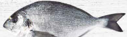
Dorada · Sea bream Sparus aurata

Consulte las tallas disponibles. Check size availability.